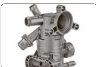
Das Gehäuse eines Kunststoff-Thermostatgehäuses.

Das Familienunternehmen Ros Bereits seit 1926 steht das Familienunternehmen Ros GmbH & Co. KG für Präzision in Kunststoff. Als Spezialist für hochpräzise technische Kunststoffspritzgussteile vertrauen führende Unternehmen aus den Bereichen Automotive, Medizintechnik, Elektrotechnik und weiteren Industrien seit mehr als 90 Jahren auf die Qualität der Ros-Produkte. Mit rund 300 Mitarbeitern an zwei Standorten in der Region Nordbayern/Südthüringen kreiert und fertigt das Unternehmen mit eigenem Werkzeugbau hochpräzise Werkzeuge für die Verarbeitung von Hochleistungskunststoffen, woraus Funktions- und Sichtteile entstehen.