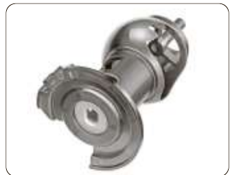
Der doppelt ausgezeichnete Drehschieber.

DÜSSELDORF/COBURG ■ Am 14. Oktober wurden anlässlich der Award Night im Crowne Plaza Düsseldorf/Neuss zum 19. Mal die Automotive Awards für herausragende Entwicklungen von Kunststoffteilen für den Fahrzeugbau prämiert. Ermittelt wurden die Sieger in einem aufwendigen Auswahlverfahren, bei dem fachkundige Experten der hochkarätig besetzten Fachjury jede Einreichung und deren Besonderheiten vorstellen und